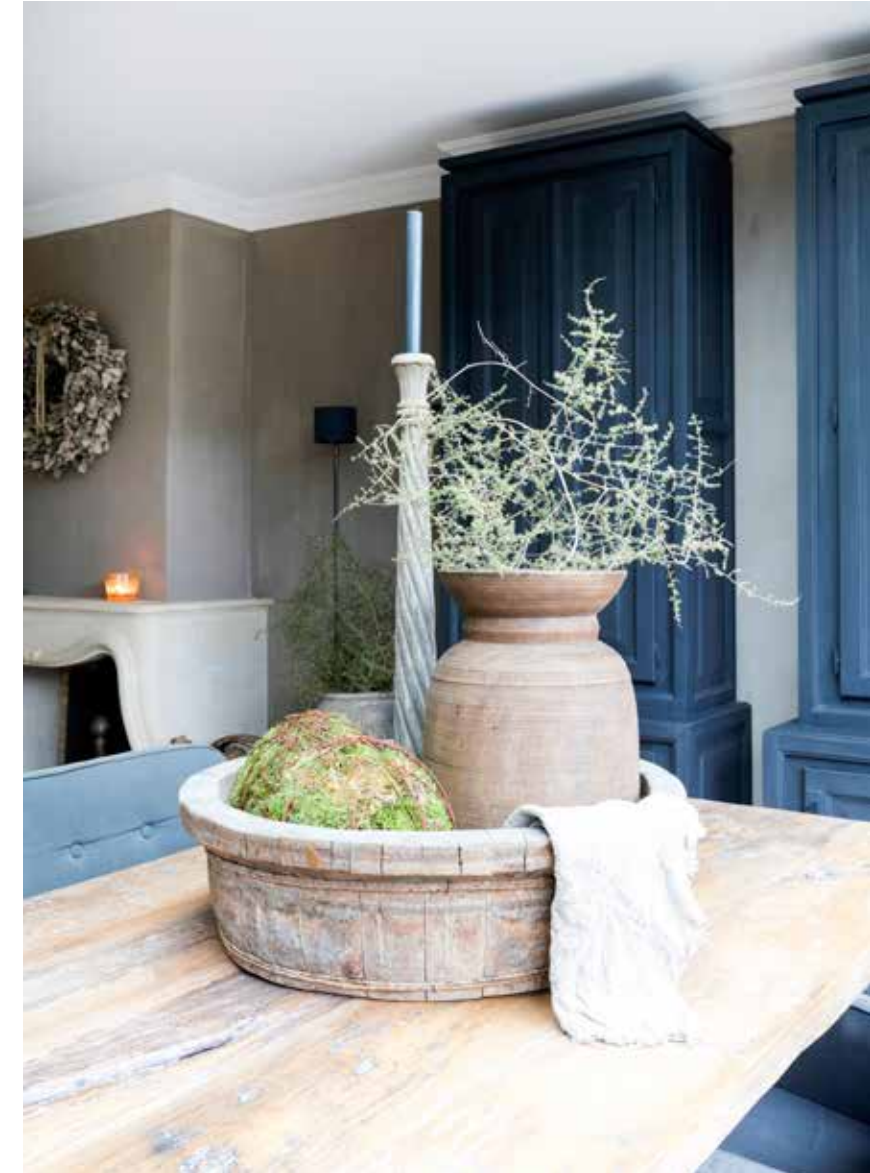
De eiken eettafel is op maat gemaakt door Restyle XL. De bak op tafel is van Rust & tiek. De draadballen zijn van Hoffz (via Deco Enzo). Tegen de wand staan twee kasten van Keijser & Co (via Sober & Sjiem)