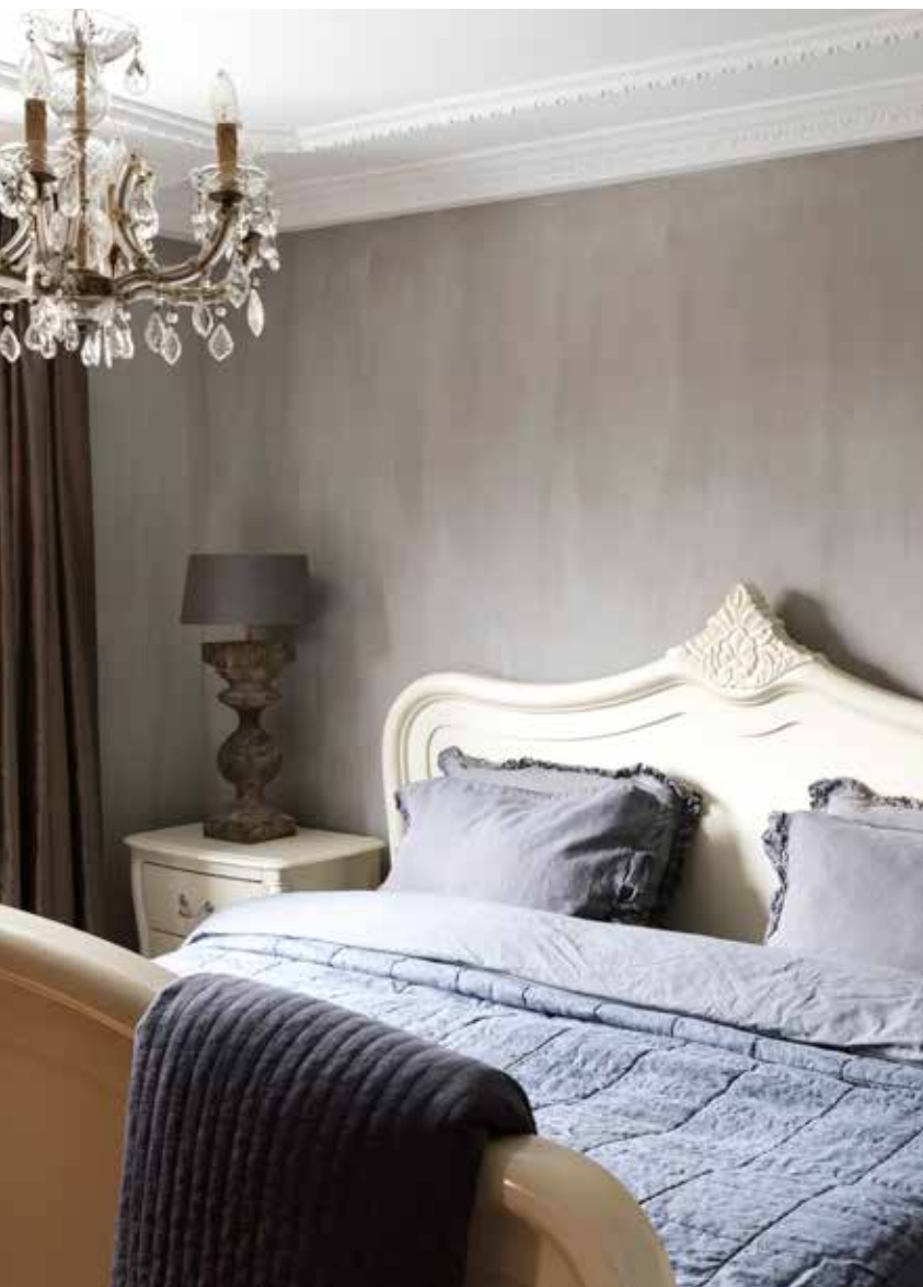
Het witte bed is van Goossens Wonen & Slapen. Het bedtextiel is een ontwerp van Marcel Wanders (via Lion Beddenshop), de spreij komt van House in Style. De wanden in de slaapkamer zijn geverfd met kalkverf in kleur Corno van Carte Colori. De accessoires kocht Pauline onder meer bij Vive La en Woonland.