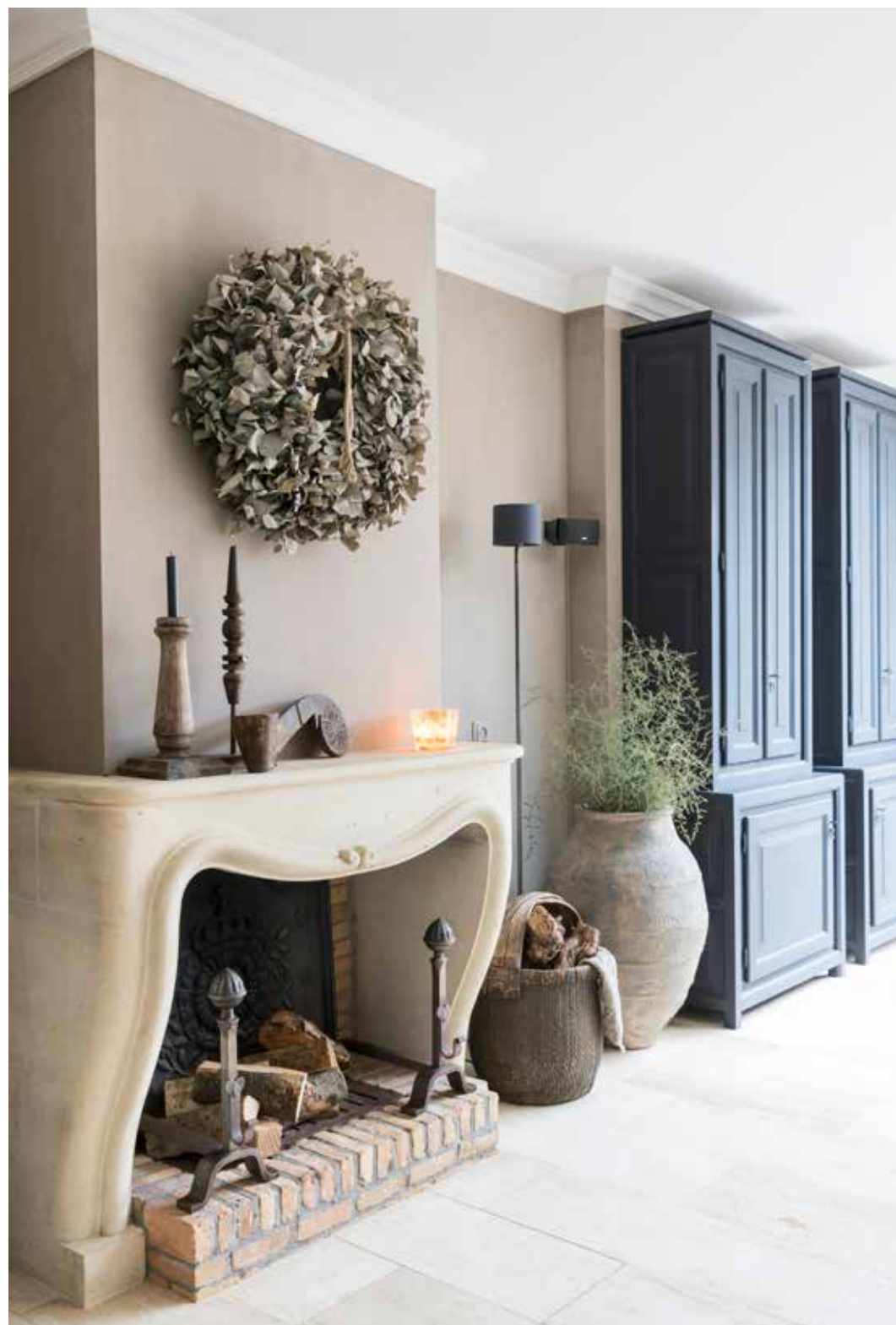
De kalkzandstenen schouw is jaren geleden gekocht bij De Opkamer. De gedroogde eucalyptuskrans is van Anja Otto Interieur. Alle wanden op de begane grond zijn door de huisschilder van Sober & Sjiké geverfd met kalkverf Colosseum van Carte Colori.

“Stukken moeten uniek zijn en iets toevoegen”